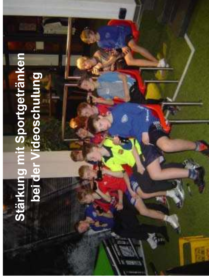
Stärkung mit Sportgetränken bei der Videoschulung

So fragte sich mancher der Jungs beim Beziehen der Doppelzimmer in der Hotelanlage: "Hat in meinem Bett schon ein Weltmeister geschlafen?"